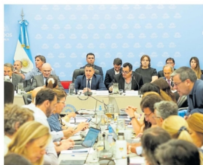
Debate. El plenario de comisiones en Diputados, en su tercer día de análisis de la Ley Ómnibus. (SINOPSIS)

van a presentar al presidente de Diputados, Martín Menem, hasta ahora la única voz autorizada para las negociaciones y el diálogo con la oposición. Desde que LA asumió el poder y lanzó un ambicioso paquete de reformas, no hubo ninguna reunión de alto nivel para coordinar el camino a seguir, a pesar de que las piden. Las negociaciones con el oficialismo se dan, de a uno, con Menem que está solo en la mesa y debe chequear con el Ejecutivo cada exigencia o pedido de cambio. Solo en algunas ocasiones participan