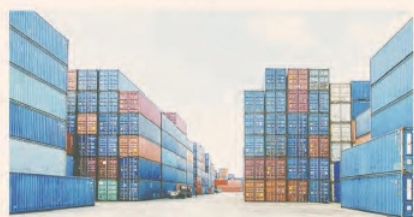
El comercio exterior busca nuevas alternativas para destrabar importaciones

Del total de la deuda registrada por importaciones, las pymes representan el 10% del total, referidos a sectores productivos diversos se estimaban con un "cupo" de entre u$s 20.000 y u$s 40.000 mensuales que les permita co-