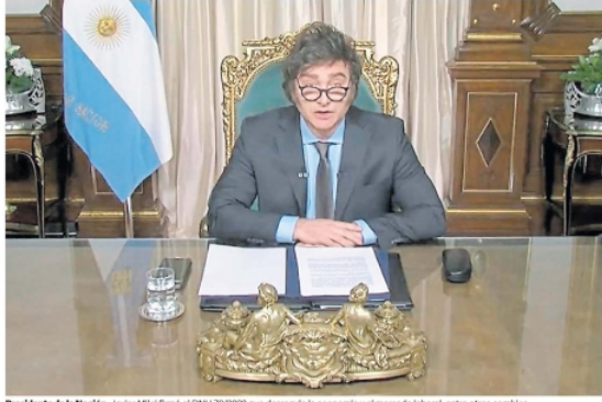
Presidente de la Nación, Javier Milei firmó el DNU 70/2023 que deregula la economía y el mercado laboral, entre otros cambios.